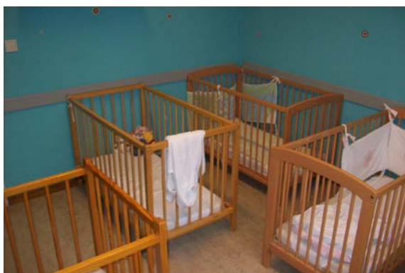
L'une de nos quatre chambres