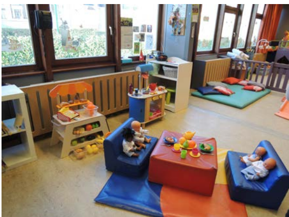
Des jeux diversifiés

Des relax sont disponibles pour les « tout-petits » mais, pour privilégier la liberté de mouvements, ils sont utilisés le moins possible (utilisés notamment pour le repas des enfants de moins de neuf mois n'ayant pas encore acquis la position assise).