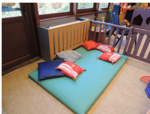
Un espace doux toujours présent